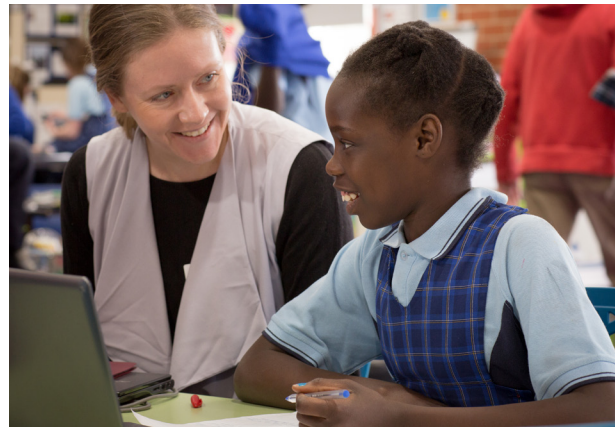
Voluntario de Mercy Connect con un joven estudiante.