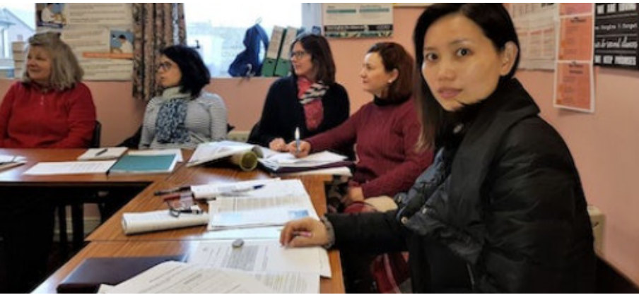
Alumnos del Welcome English Language Centre, en la ciudad de Cork.

lingüísticas de los inmigrantes en la comunidad: “Welcome English desea que a todos los inmigrantes inscritos en el centro se les facilite la consecución de un nivel funcional de inglés para ayudarles en su integración social, así como para mejorar su progreso educativo” . Más allá de las clases de inglés y alfabetización, Ángela subraya que “la provisión de un espacio acogedor para que todos los que vengan a nuestro centro puedan reunirse y charlar y la inclusión social es tan importante en nuestro centro para todos” . Los valores de la hospitalidad, el respeto y la igualdad son el núcleo de este ministerio, que ofrece una actitud y un ambiente de acogida centrados en la persona, reconociendo la dignidad de cada uno y la importancia de respetar la diversidad cultural.