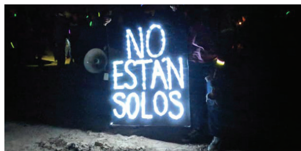
En una experiencia de inmersión de la Misericordia en la frontera entre Estados Unidos y México, un mensaje para los migrantes en el viaje: “No están solos”.

Al priorizar el bienestar y la autosuficiencia, estas alternativas permiten a las personas contribuir plenamente a la sociedad si se asegura la residencia, o afrontar mejor la difícil posibilidad de las órdenes de retorno. Los programas ATD son significativamente más rentables que la detención privativa de libertad, y se ha demostrado que mantienen altas tasas de cumplimiento, especialmente cuando los migrantes pueden satisfacer sus necesidades básicas, y son capaces de acceder al apoyo legal y social necesario para tomar decisiones fundamentadas sobre su viaje migratorio. 33 Los programas de TCA demuestran que la detención no es necesaria durante el proceso de inmigración, y que los casos pueden resolverse mientras las personas están libres en las comunidades. El fin de la detención de inmigrantes no sólo es posible, sino que es beneficioso para los Estados y necesario para garantizar la dignidad y los derechos de las personas en movimiento.