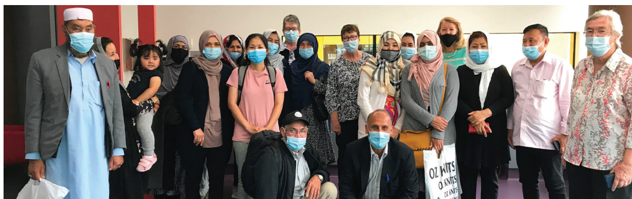
Voluntarios y estudiantes adultos en la Biblioteca de Dandenong para Mercy Connect Melbourne.