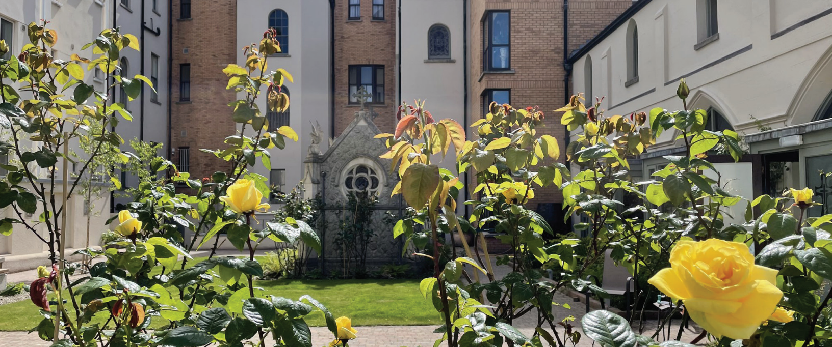
El Jardín Sagrado del Centro Internacional de la Misericordia.

La encuesta llevada a cabo por el Grupo de Trabajo de Acción Global de la Misericordia sobre Migración tenía como objetivo recoger y analizar las experiencias y el trabajo de la Misericordia en todo el mundo en relación con la migración y el desplazamiento. Arraigados en un carisma y una tradición espiritual caracterizados por la hospitalidad y el cuidado de los más marginados, y guiados por un marco de derechos humanos que sitúa las experiencias de las personas en el centro, los colaboradores, los ministerios y las comunidades de la Misericordia acogen al extranjero, proporcionan refugio y apoyo, intentan defender los derechos de los migrantes y los refugiados, y crean un sentimiento de pertenencia e inclusión.