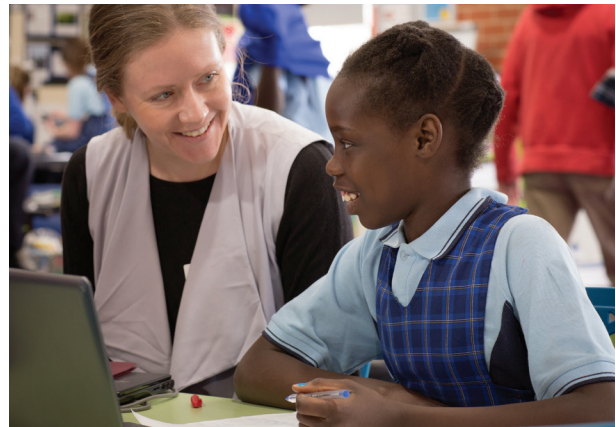
Voluntario de Mercy Connect con un joven estudiante.