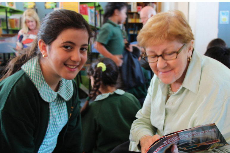
Voluntario de Mercy Connect con un estudiante.

Del mismo modo, un estudiante refugiado de Irak en Australia a través del Líbano dice: “Terminé el año 12 en Irak en 2014. Sin embargo, soy estudiante de 12º curso en el Bankstown Senior College y espero ir a la universidad el año que viene. Es bastante difícil volver a estudiar en el instituto a los 24 años por el idioma y el sistema educativo y el entorno