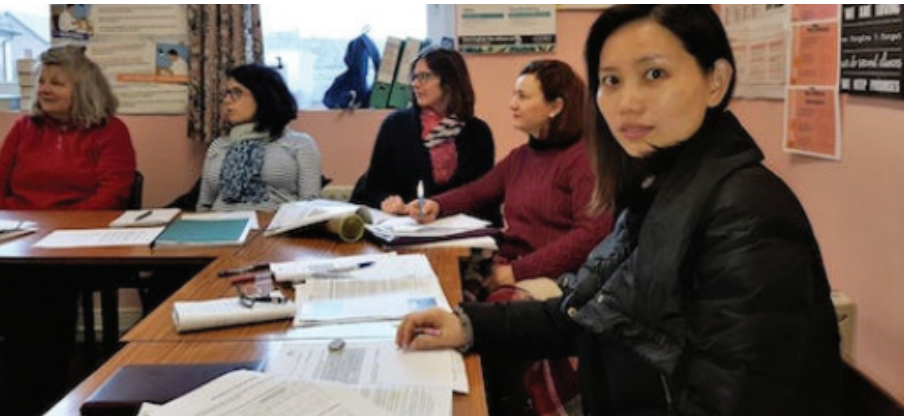
Alumnos del Welcome English Language Centre, en la ciudad de Cork.